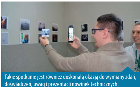
Takie spotkanie jest również doskonałą okazją do wymiany zdań, doświadczeń, uwag i prezentacji nowinek technicznych.