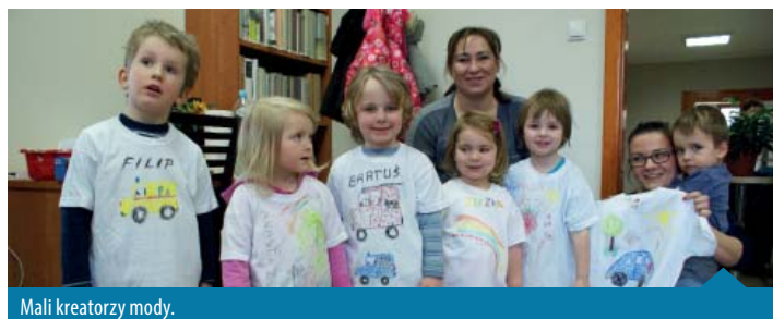
Mali kreatorzy mody.

Od 2 lutego br. w Bibliotece Publicznej odbywają się cykliczne warsztaty dla dzieci w ramach projektu „Wielka granda w bibliotece”. Warsztaty mają na celu wyrównywanie szans edukacyjnych dzieci nieuczestniczących w edukacji przedszkolnej oraz integrację wielopokoleniową.