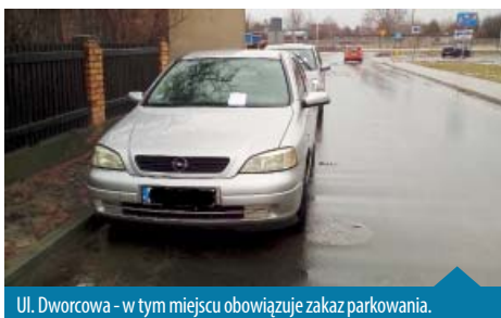
Ul. Dworcowa - w tym miejscu obowiązuje zakaz parkowania.

Zbliża się wiosna, a co za tym idzie zaczną się porządki w ogrodach. Przypominam o całkowitym zakazie spalania odpadów roślinnych (liści, gałęzi itp.). Odpady takie należy wywieźć na kompostownie, składować we własnym kompostowniku lub pozostawić do odbioru własnie odpadów zielonych przez GOAP.