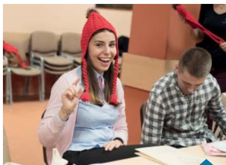
Wolontariusze podczas spotkania.