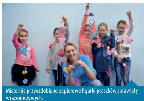
Misternie przyozdobione papierowe figurki ptaszków sprawiały wrażenie żywych.

W następnym tygodniu dzieci, młodzież i dorośli w pracowni na warsztatach zatytułowanych „Stylowe lodołamacze” wykonali statki, kutry, lodołamacze i jachty, stare morskie krypy i pordzewiałe statki widma. Ze stoczni wyobraźni popłynęły w świat na dalekie morza dzieła sztuki skutniczej w postaci stylowych stateczków powstałych ze starych desek i wszelkiego żelastwa. Dzieci poczuły na własnych palcach, co to znaczy porządne uderzenie młotkiem. Nauczyły się wbijania