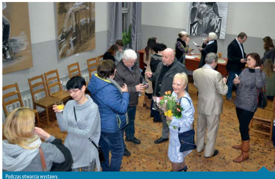
Podczas otwarcia wystawy.

Wystawa zatytułowana „Malarki” nie jest tylko wystawą ładnych obrazów, jest zapisem drogi, przemiany autorek w malarki i za chwilę w artystki. Obie panie od lat same studiują malarstwo. Poznają różne style, techniki, odwiedzają muzea, wystawy malarstwa najnowszego i dawnego. Malują kopie wielkich mistrzów i tak poznają wiele sposobów na malowanie. Podejmują w końcu swoje własne tematy i zaczynają malować po swojemu.