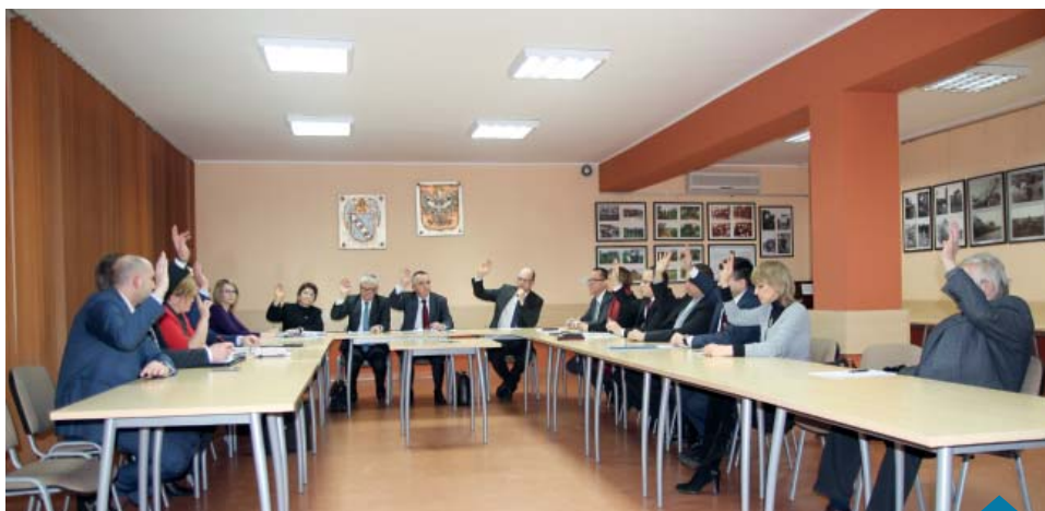
Głosowanie nad uchwałą oświatową.

W Szkole Podstawowej im. Leona Masiańskiego w Białężynie oraz Szkole Podstawowej im. Powstańców Wielkopolskich w Długiej Goślinie będą się uczyły dzieci w klasach I-VIII. Zachodzi jednak konieczność przystosowania sal do