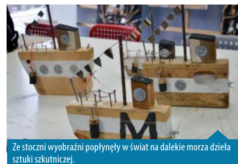
Ze stoczni wyobraźni popłynęły w świat na dalekie morza dzieła sztuki skutniczej.

Dzieciaki miło i efektywnie spędziły czas, który tak szybko upłynął. Pamiętajcie! Zawsze możecie do nas wracać, także