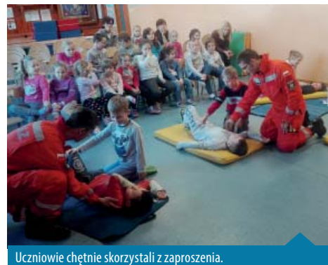
Uczniowie chętnie skorzystali z zaproszenia.

W ramach podziękowań najmłodszy wręczyli prowadzącym własnoręcznie wykonane serduszka. Ćwiczenia pokazały, że dzieci szybko nabywają podstawowe umiejętności, które zapoczątkują w latach późniejszych. Taki też jest cel pokazów. Tworzymy pewną podstawę do dalszego kształcenia. Swoimi umiejętnościami, wiedzą i odwagą dzieci zawstydzilyby niejednego dorosłego. Na koniec dzieci wypełniły test wiedzy.