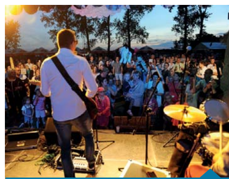
Gwiazda wieczoru - zespół Toledo.

ORGANIZATORZY DOŻYNEK GMINNYCH UCHOROWO 2016: Miejsko-Gminny Ośrodek Kultury i Rekreacji w Murowanej Goślinie, Sołectwo Uchorowo - Zadanie zrealizowano z pomocą finansową Gminy Murowana Goślina