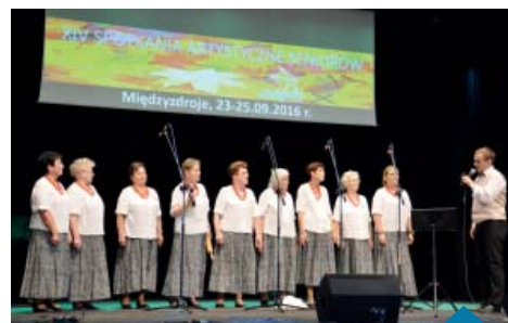
Grand Prix w kategorii zespoły śpiewacze otrzymały Goślińskie Chabry.