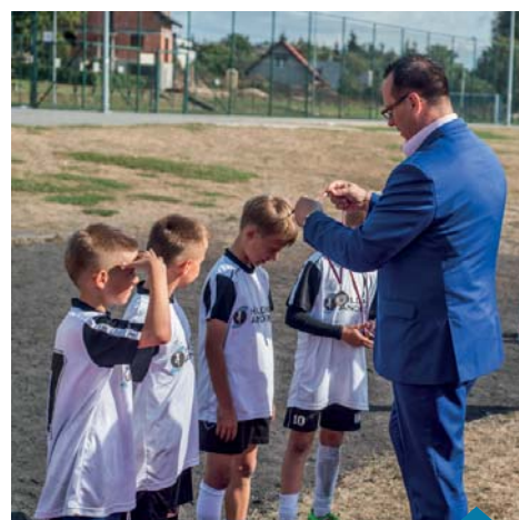
Dekoracja zawodników UKS Concord.