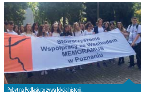
Pobyt na Podlasiu to żywa lekcja historii.

nauczycielom polskim - zesańcom Sybiru. Pomimo, że żar lał się z nieba, nasi uczniowie dzielnie przeszli spod Pomnika Katyńskiego do kościoła pw. Ducha Świętego, gdzie wzięli udział w nabożeństwie. Na zakończenie uroczystości przy Pomniku Grobie Nieznanego Sybiraka odbył się apel, podczas którego modlono się w obrządku katolickim, prawosławnym i ewangelicko-augsburskim. Uroczystość zakończyła się odśpiewaniem przez żołnierza 18. Białostockiego Pułku Rozpoznawczego hymnu Sybiraków. Niejednemu z nas ze wzruszenia zakręciła się łezka w oku. Pobyt na Podlasiu to żywa lekcja historii i przekazywania pamięci o naszych przodkach. Młodzi ludzie mieli okazję uświadomić sobie, że Polacy wielu wyznań potrafią żyć obok siebie i wzajemnie się szanować, a wielokulturowość Podlasia