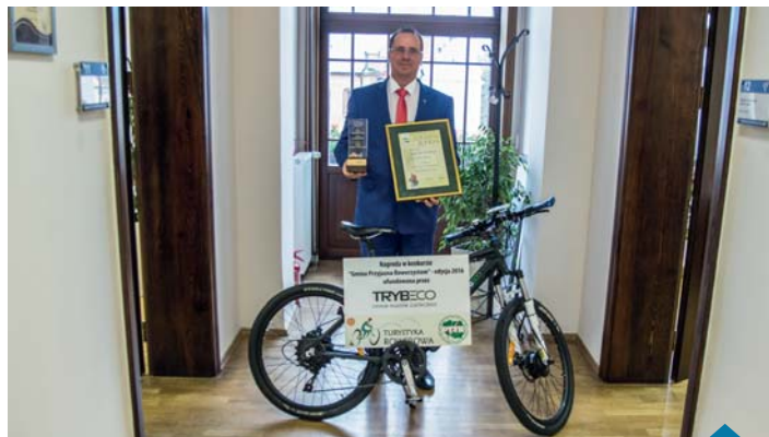
Burmistrz z nagrodą Grand Prix konkursu „Gmina przyjazna rowerzystom”.