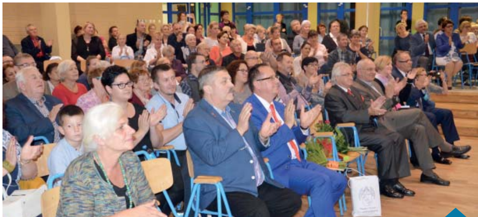
Publiczność zgromadzona na uroczystości.

W ramach działalności organizacyjnej chórów Canzona od 2007 roku odbyły się: Międzynarodowe Spotkania Chóralne oraz dziewięć edycji Międzynarodowego Festiwalu Chóralnego im. ks. Edmunda Szymańskiego. Realizacja koncertów festiwalowych jest możliwa dzięki współpracy z Miejsko-Gminnym Ośrodkiem Kultury i Rekreacji oraz wsparciu finansowym