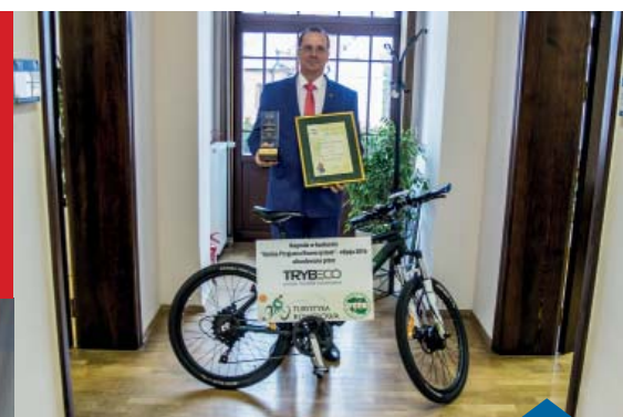
GRAND PRIX KONKURSU „GMINA PRZYJAZNA ROWERZYSTOM”