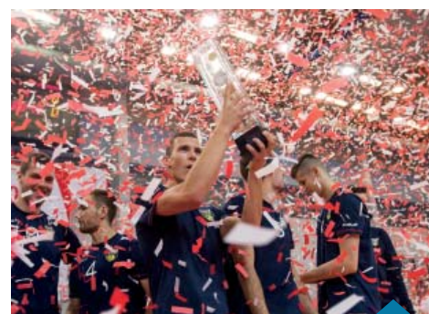
Lotos Trefl Gdańsk zwyciężąc XII Memoriał A. Gołasia.