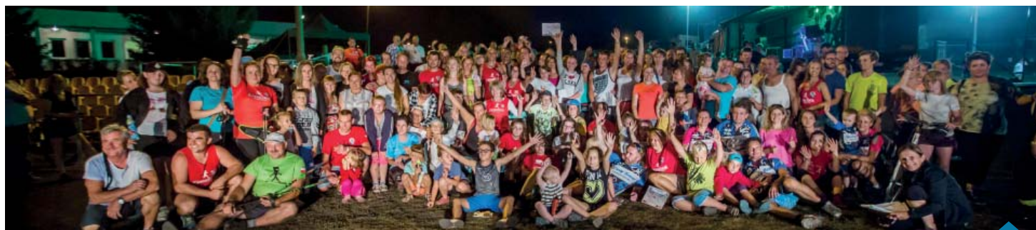
Meta, godz. 20.00. Te emocje chce poczuć roku na rok coraz więcej osób.