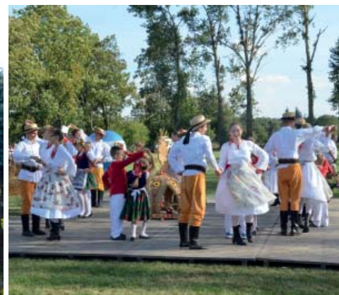
↑ Zespół folklorystyczny Goślinianie.