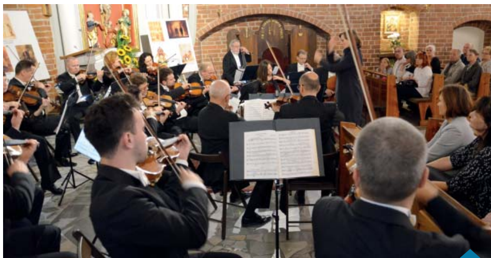
Wydarzenie przyciągnęło melomanów, twórców i wielbicieli kultury oraz wierną, wysmakowaną goślińską elitę publiczności.

Dzieło zostało zainspirowane wystawą akwarel i rysunków Wiktora Hartmanna (1834–1873), zorganizowaną latem 1874 roku, niedługo po jego śmierci. Był rok 1870, kiedy Modest Musorgski spotkał po raz pierwszy Wiktora Hartmanna, rosyjskiego malarza i architekta. Obydwu artystów łączyły wspólne poglądy na wiele istotnych dla nich spraw, toteż rychło zostali serdecznymi przyjaciółmi. Niestety,