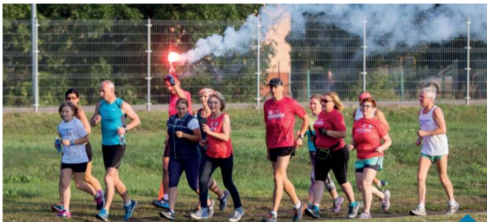
Pierwsze, beztroskie kółeczko...

Atmosfera tej imprezy nie da się porównać z żadnym biegiem, a satysfakcji z żadnym medalem. Atrakcji zdecydowanie więcej, niż w ubiegłym roku. Strażacy z OSP Boduszewo ustawili obok bieżni kurtynę wodną, a także napełnili niewielki basen. Ciasta pieczone w ilościach przemysłowych to już standard. Grochówka, grill, muzyka, pokazy tańca to też stałe i miłe towarzystwo. Ale tym razem mieliśmy także przejażdżki motocyklowe, szkolenie nordic walking, pokazy szkolenia psów obronnych, ognisko, a nad naszymi głowami latali wicemistrzowie świata na motoparalotniach. Lot z Tomaszem Kroteckim można było zresztą wylicytować wśród niespodzianek i fantów przekazanych przez dar-