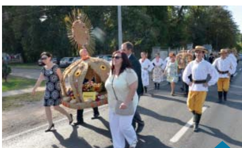
Dożynkowy korowód z wieńcami.