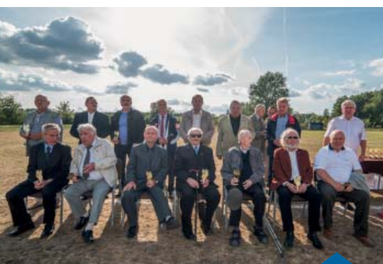
JUBILEUSZ 95-LECIA MKS CONCORDIA