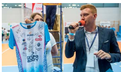
Licytacje wspierają niepełnosprawne dzieci i młodzież z naszej gminy.