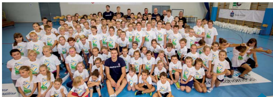
Prowadzący oraz uczestnicy warsztatów siatkarskich.