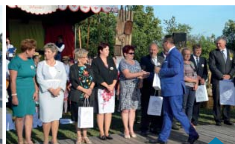
Sołtysi i przewodniczący osiedli otrzymali z rąk burmistrza upominki.