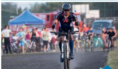
Im więcej okrążeń, tym więcej na skórze czarnego pyłu.