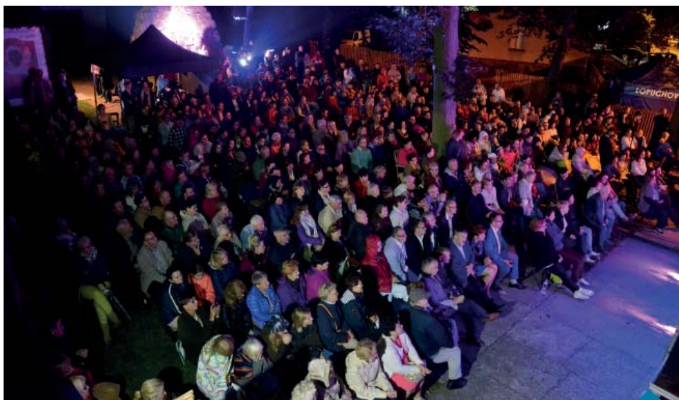
Widzowie koncertu Stanisława Soyki.