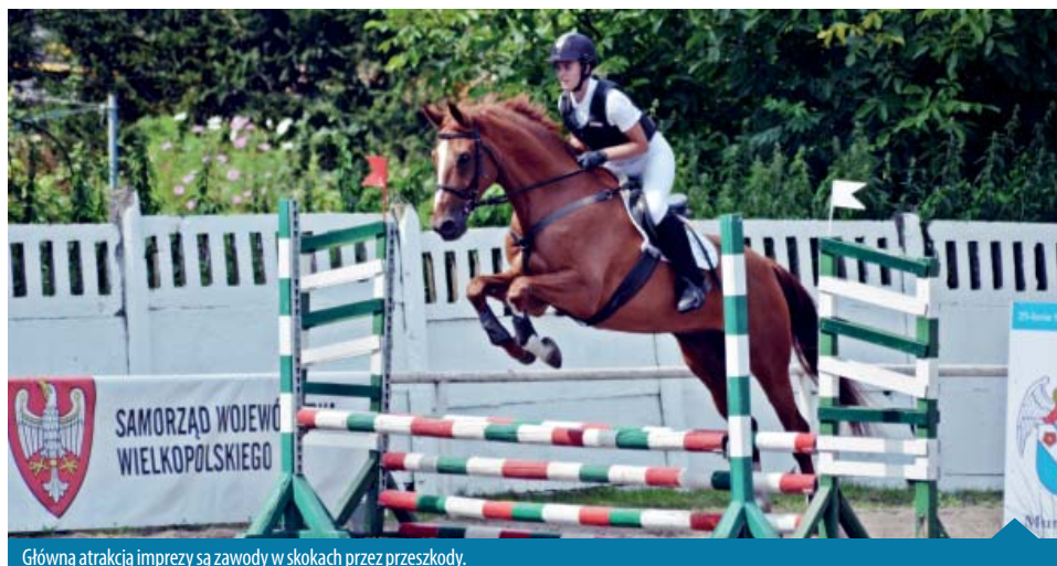
Główną atrakcją imprezy są zawody w skokach przez przeszkody.

Bardzo dużym zainteresowaniem cieszyły się dodatkowe atrakcje w formie konkursów między przejazdami konnymi oraz wystawa prac artystycznych związanych z końmi. Postaramy się w przyszłym roku jeszcze rozbudować tą część.