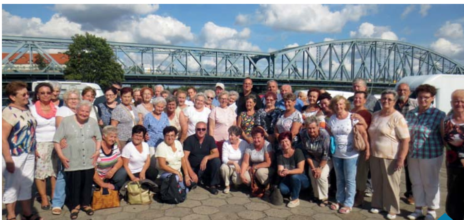
Burmistrz zaprosił seniorów na wycieczkę autokarową do Torunia.

Zdaniem uczestników czerwcowego pobytu wypoczynkowego emerytów w Dziwnowie, należy stwierdzić, że należało on do udanych. W ośrodku tym byliśmy pierwszy raz, ale spodobał się naszym seniorom.