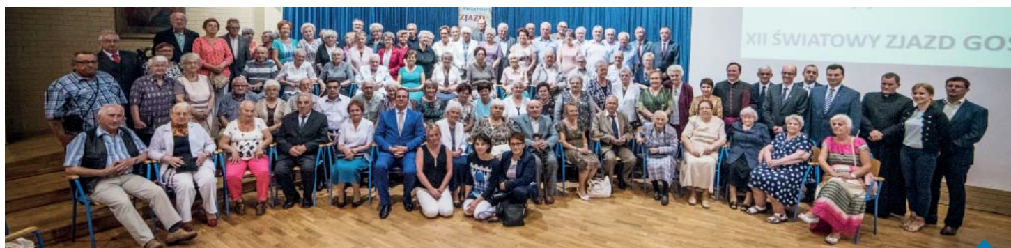
Tradycyjne wspólne zdjęcie uczestników zjazdu.