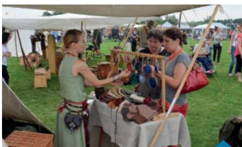
...a także stoiska z rękodziełem.