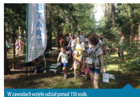
W zawodach wzięło udział ponad 150 osób.