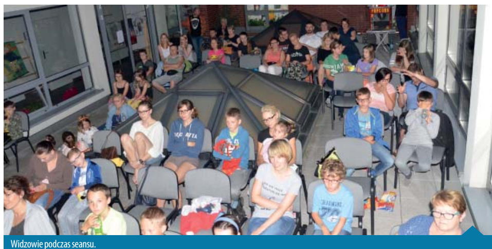
Widzowie podczas seansu.

26 sierpnia pokaz filmu „Snajper” zakończył tegoroczną edycję Kina Letniego „Zorza”. Projekt kina wakacyjnego na świeżym powietrzu został zapoczątkowany w 2015 roku przez Grupę Miłośników Kina Zorza w Murowanej Goślinie i, jak widać po tegorocznej frekwencji, jest to trafiony pomysł na uatrakcyjnienie oferty kulturalnej gminy.