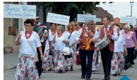
Korowód zespołów do auli Gimnazjum nr 1.

Impreza została zorganizowana przez Ośrodek Kultury i Zespół Wokalny