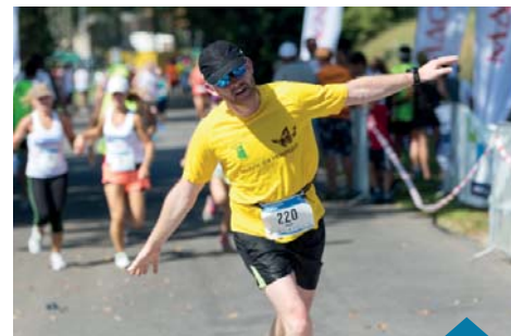
Nie wszyscy byli zmęczeni.