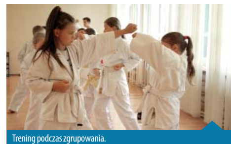
Trening podczas zgrupowania.

► W dniach od 2 do 12 lipca br. odbyło się letnie zgrupowanie karate w Pokrzywnie w Górach Opawskich. Wyjazd zorganizował Klub Karate GANKAKU z Murowanej Gośliny przy finansowym wsparciu Miasta i Gminy Murowana Goślina.