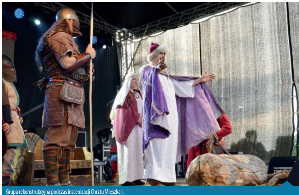
Grupa rekonstrukcyjna podczas inscenizacji Chrztu Mieszka I.

Pod takim właśnie hasłem przebiegał tegoroczny, XIV Jarmark św. Jakuba w Murowanej Goślinie w związku z 1050 rocznicą chrztu Księcia Mieszka. Składało się na niego kilka wydarzeń.