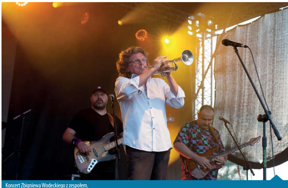
Koncert Zbigniewa Wodeckiego z zespołem.

Na scenie zaprezentowano przedstawienie o początkach państwa polskiego, natomiast za płytą stadionu dzieciaki ustawiały się w kolejkach do dmuchańców, trampolin, a obok także do przenośnego escape roomu.