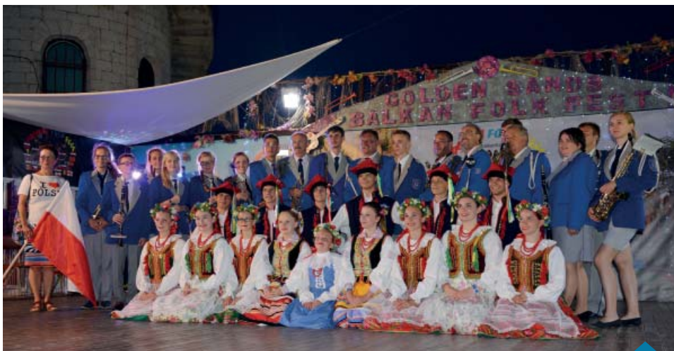
Goślińskie zespoły na scenie festiwalu.

Należy podkreślić fakt dużego zaskoczenia i wielu pochwał ze strony organizatorów festiwalu, którzy twierdzili, że po raz pierwszy na festiwalu mają przyjemność gościć współpracujące na scenie Zespół Folklorystyczny i Orkiestrę