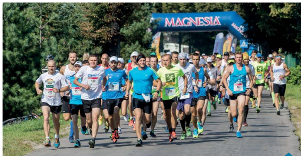
Start biegu z ulicy Mściszewskiej.

ZA POMOC W ORGANIZACJI BIEGU BARDZO DZIĘKUJEMY SZEFEWEJ I PANIOM Z PRZEDSZKOLA NIEPUBLICZNEGO „GROSZEK”. PRZEDSZKOLE WZIĘŁO POD SWOJE OPIEKUŃCZE SKRZYDŁA DZIECI BIEGACZY, KTÓRZY STARTOWALI W MUROWANEJ DYSZCE.