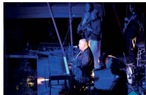
Musica Profana - Stanisław Soyka.

Serdecznie dziękujemy tym, którzy pomagają nam w utrzymaniu ciągłości i poziomu festiwalu, obdarzając nas wsparciem finansowym, własną pracą i życzliwością, czyli: