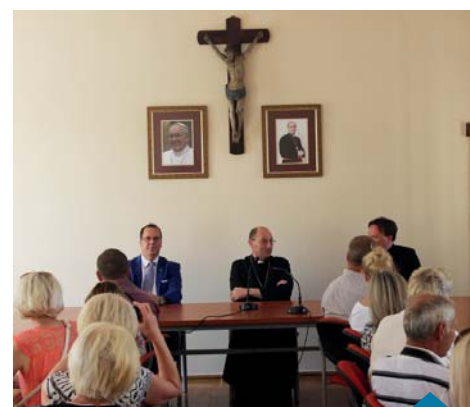
Audycja u Księdza Prymasa Wojciecha Polaka.

Deszcz na szczęście nie zakłócił wieczornego ogniska w Zielonce, na które zostały również zaproszone rodziny, które znają się z naszymi gośćmi od lat. Ostatniego dnia wizyty, po opuszczeniu Murowanej Gośliny, goście wstąpili także do Lichenia. Dorośli późnym wieczorem wrócili do domów, a wczesnym rankiem tym samym autobusem wyruszyła do nas grupa dzieci z Oszmiany, które spędzą u nas, jak co roku, już po raz siódmy, dwutygodniowe wakacje.