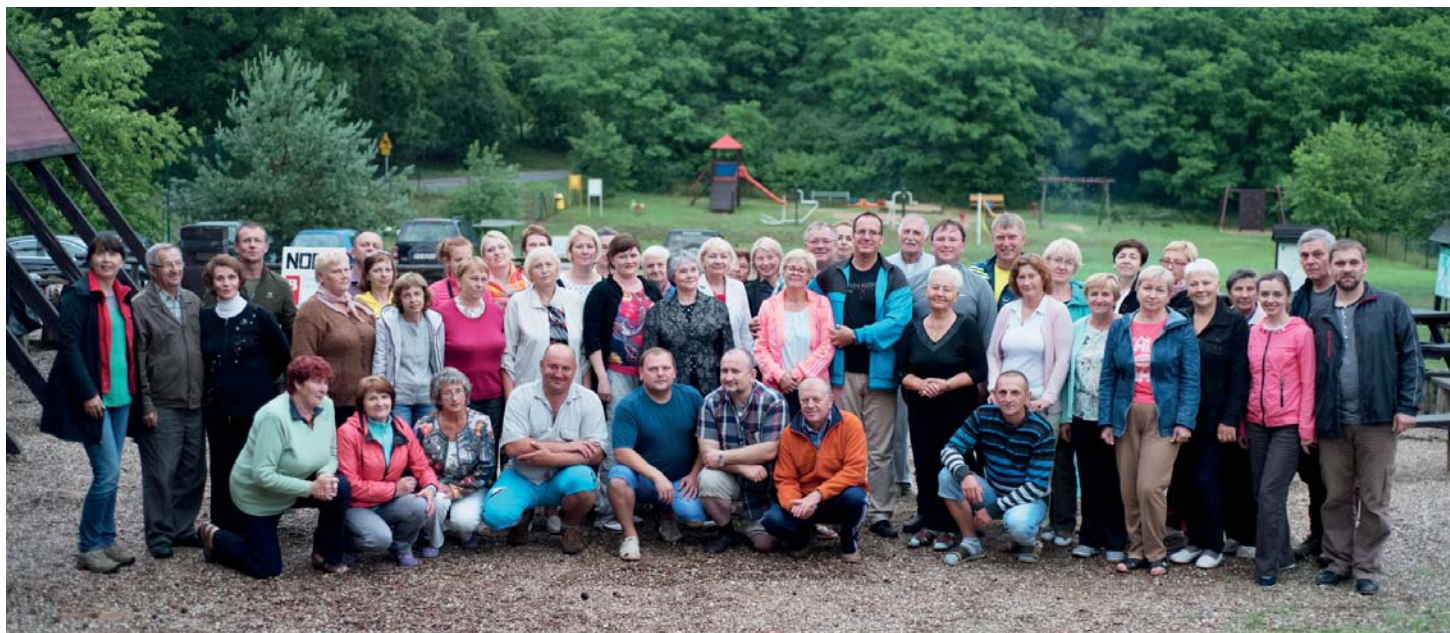
Goście z Oszmiany oraz ich goślińscy przyjaciele podczas ogniska w Zielonce.