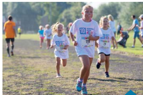
Rano biegały dzieci.