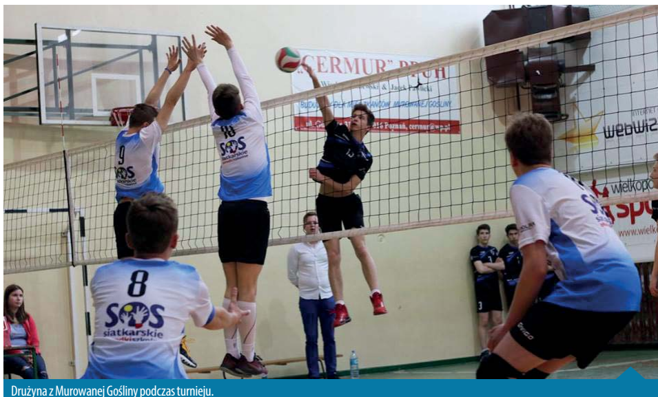
Drużyna z Murowanej Gośliny podczas turnieju.

Drugi dzień zmagania w kategorii chłopców rozpoczął pojedynek lidera z Piły z zespołem Murowanej Gośliny 1 (zakończony 1:2). Natomiast siatkarki z Murowanej Gośliny w pierwszym swoim meczu w niedzielę pokonały zawodniczki ZSMS Poznań 2, 2:0.