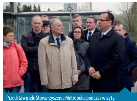
Przedstawiciele Stowarzyszenia Metropolia podczas wizyty.

Ostatnim etapem przebudowy węzła będzie wykonanie dojazdów od strony ul. Kmicica i Podbipięty. To rozwiązanie zdecydowanie ułatwi dojazd do przystanku szczególnie mieszkańcom wschodniej części miasta oraz miejscowości sąsiednich. Obecnie, aby dostać się na dworzec muszą oni przejeżdżać ul. Gnieźnieńską przez most, na którym funkcjonuje ruch wahadłowy.