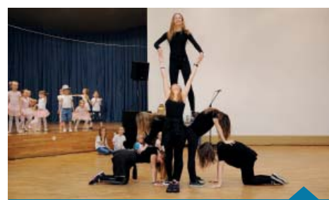
Patyczaki z Gimnazjum nr 1.