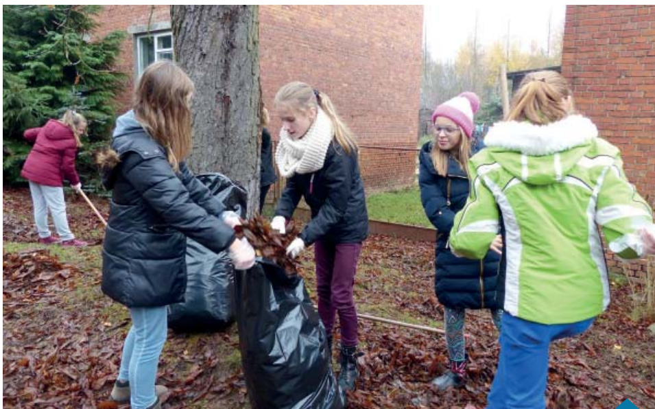
Klasy VI porządkowały trasy turystyczne.

Również klasy VI stwierdziły, że był to udany dzień, mimo, że jako najstarsze zawsze wykonują najtrudniejsze zadania: po spotkaniu z prelegentem przemierzają kilometry tras turystycznych porządkując je.