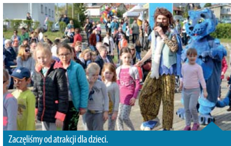
Zaczelismy od atrakcji dla dzieci.

Przypomnijmy, że 1 maja obchodziliśmy Święto Pracy, 2 maja Dzień Flagi Rzeczypospolitej Polskiej, a następnego dnia Święto Konstytucji 3 Maja. Nie ma lepszej okazji do bycia razem, aby w piękne słoneczne majowe popołudnie zawirować na przysłowiowym parkiecie. Pogoda wymarzona, słońce nad stadionem i wiele atrakcji: stoiska z zabawkami dla dzieci, dmuchańce, gastronomia, lody, wata cukrowa, popcorn. Nasi strażacy (obchodzący z kolei swoje święto 4 maja) przygotowali stanowiska z grillami i dla wszystkich kociół pysznej grochówki w prezencie. Dla najmłodszych przygotowano blok zabaw i konkursów w klimacie jaskiniowców. Strażacy z Jednostki Ratowniczo-Gaśniczej nr 8 PSP w Bolechowie przeprowadzili warsztaty z zakresu udzielania pierwszej pomocy i ratownictwa. Dla doro-