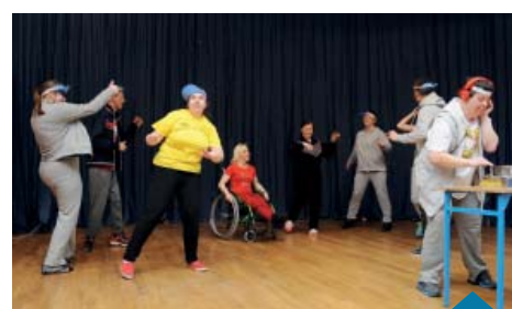
Warsztaty Terapii Zajęciowej.