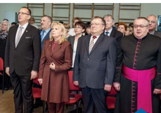
UROCZYSTA SESJA RADY MIEJSKIEJ