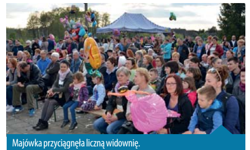
Majówka przyciągnęła liczną widownię.