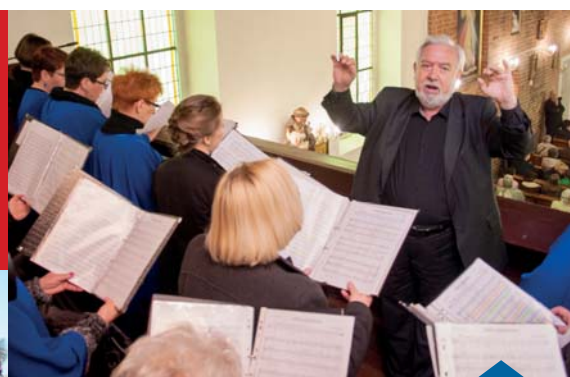
90 LAT CHÓRU MIESZANEGO VOCANTES