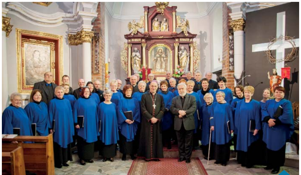
Chór Vocantes wraz z arcybiskupem Wojciechem Polakiem.