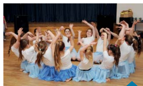
Zespół Klasy Muzycznej z SP 2.

i dziękujemy za udział. Dzięki Wam było kolorowo, spontanicznie i żywiłowo. To Wy dostarczyliście widzom moc doznań i niesamowitych wrażeń. Serdecznie z całego serca dziękujemy.