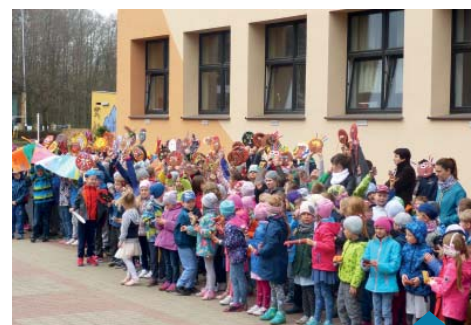
Jedna z imprez projektu UNICEF.