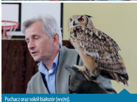
Puchacz oraz sokół białozór (wyżej).