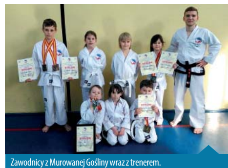
Zawodnicy z Murowanej Gośliny wraz z trenerem.