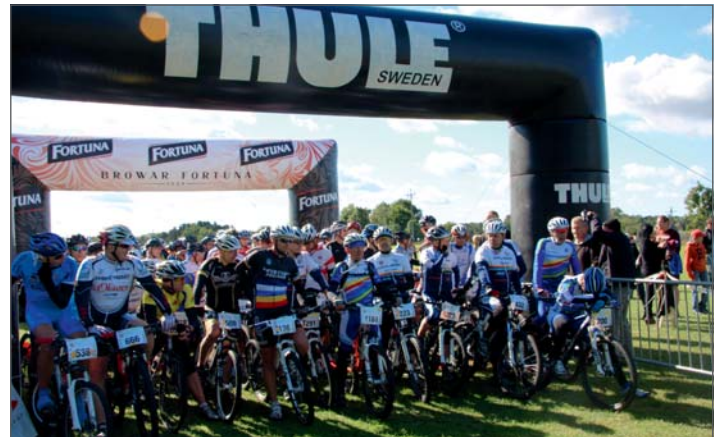
Start maratonu MTB w Łopuchowie.