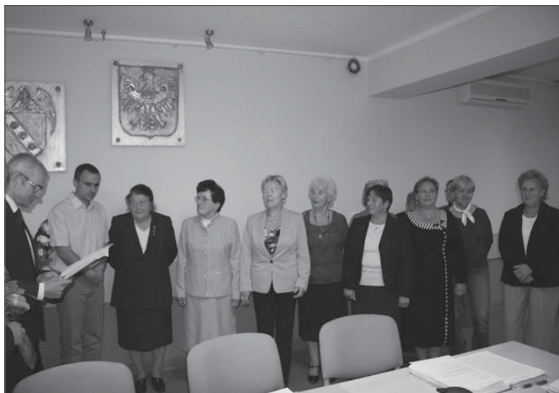
Zespół Śpiewaczy „Goślińskie Chabry” zajęli I miejsce w swojej kategorii podczas Wojewódzkiego Przeglądu Seniorów Twórczości Artystycznej Pre-Ars 2012 w Pile.

Szerszą relację oraz wszystkie uchwały podjęte na sesji można znaleźć na stronie internetowej gminy oraz w Biuletynie Informacji Publicznej. Kolejna sesja odbędzie się 30 października 2012 roku.