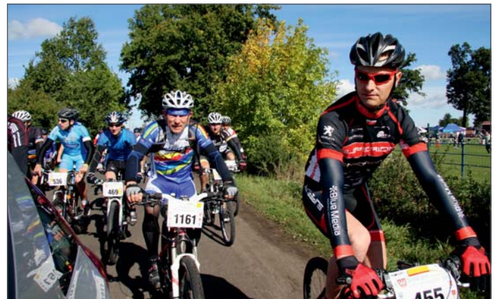
Na trasie maratonu MTB.