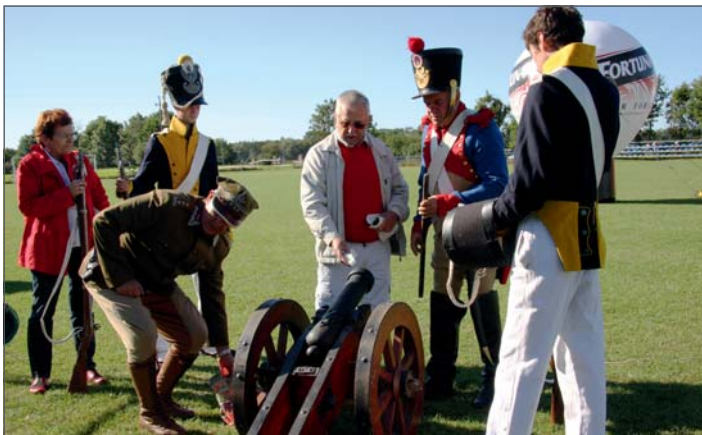
Armata dwała sygnał do startu maratonu.