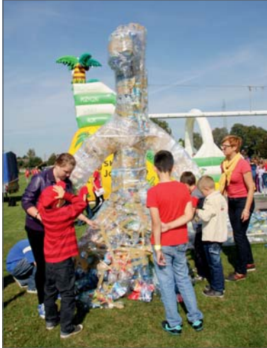
Rzeźba z plastikowych butelek.