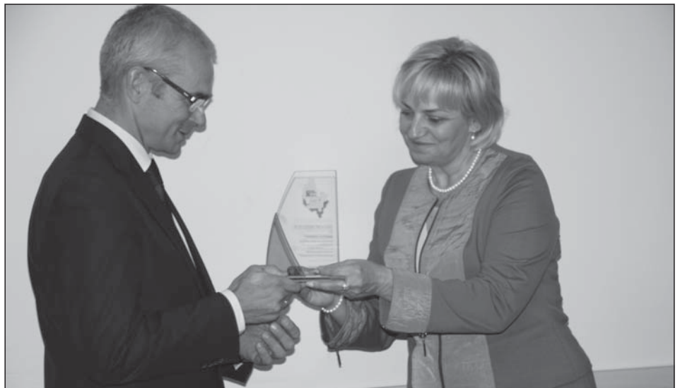
Prezes Stowarzyszenia Sołtysów Województwa Wielkopolskiego podziękowała Burmistrzowi za dotychczasową współpracę.

W związku z ciągłym wzrostem wysokości wypłacanych dodatków mieszkaniowych