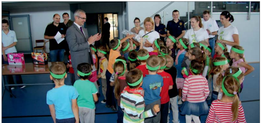
Smocze Wzgórze odbiera nagrodę w konkursie plastycznym.