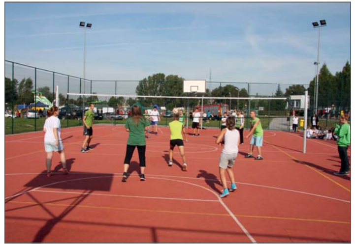
Turniej siatkówki podczas Eko Pikniku dla szkół.