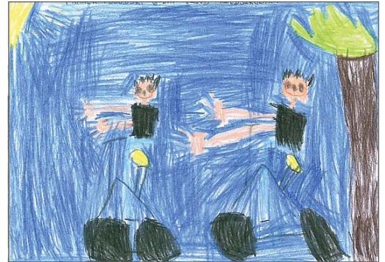
↑ III miejsce: Franek Pogodski