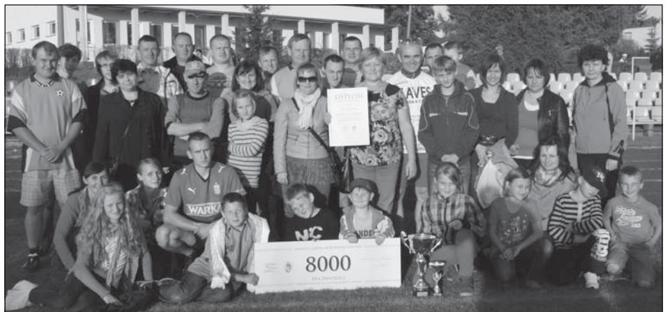
Zwycięzcy Turnieju Sołectw 2012 - Białężyn.

Turniej zorganizowała spółka MG Sport ze środków gminy Murowana Goślina.