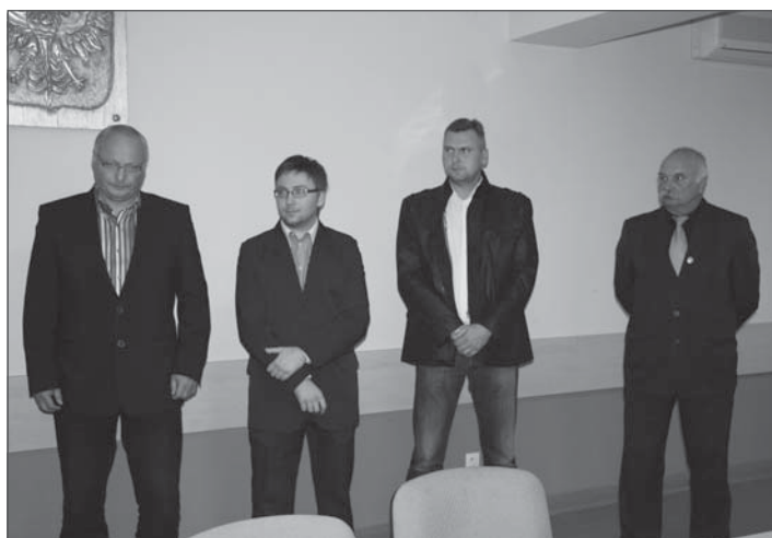
Od lewej: Sołtys Wojnówka, Przewodniczący Osiedli nr 5, 4, 6.