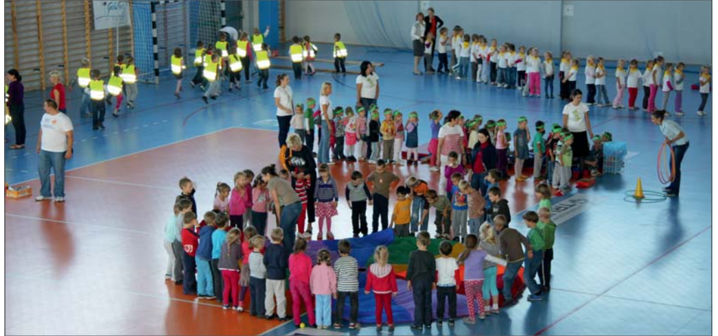
Impreza sportowa dla przedszkolaków.