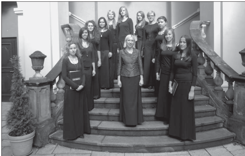
Chór Kameralny „Canzona”.