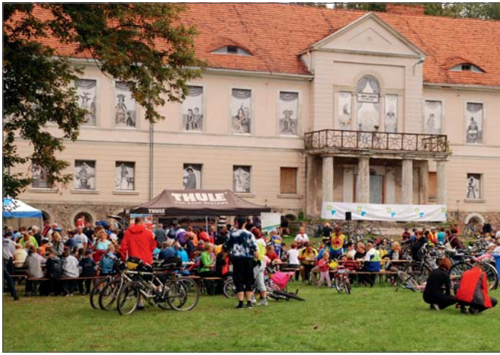
VI Cysterski Rajd Rowerowy - meta w Owińskach.