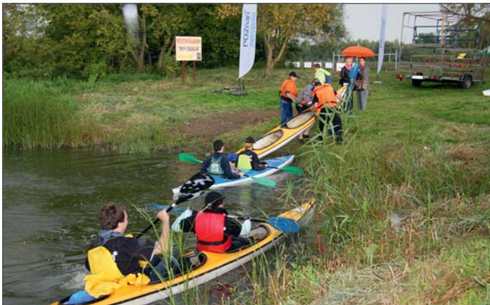
Przysłań Binduga jeszcze bez deszczu.