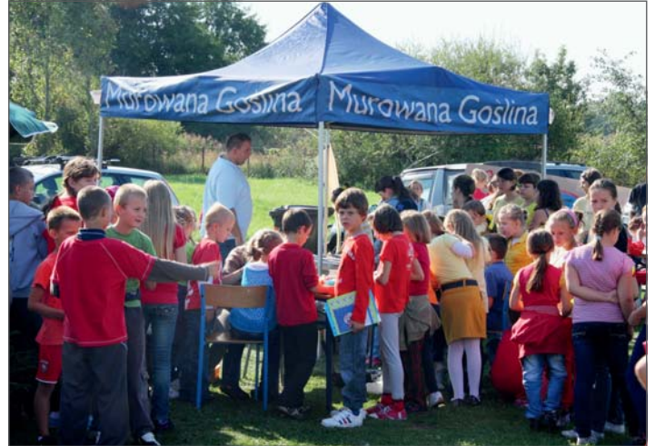
Eko Piknik - gadzety gminne cieszyły się zainteresowaniem.