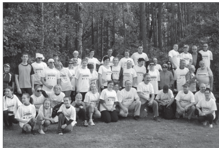
Rowerzyście na mecie rajdu LGD Kraina 3 Rzek.