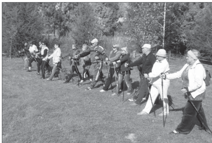
Uczestnicy instruktażu nordic walking w Dąbrówce Kościelnej.

Szersza relacja i zdjęcia dostępne na stronach: www.murowana-goslina.pl ; www.puszcza-zielonka.pl ; www.kraina3rzek.pl oraz na profilu gminy Murowana Goślina na facebooku.