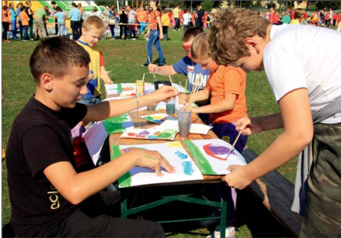
Konkurs malarski na ślimaka Cittaslow.