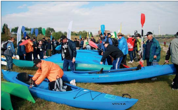
Start spływu kajakowego.