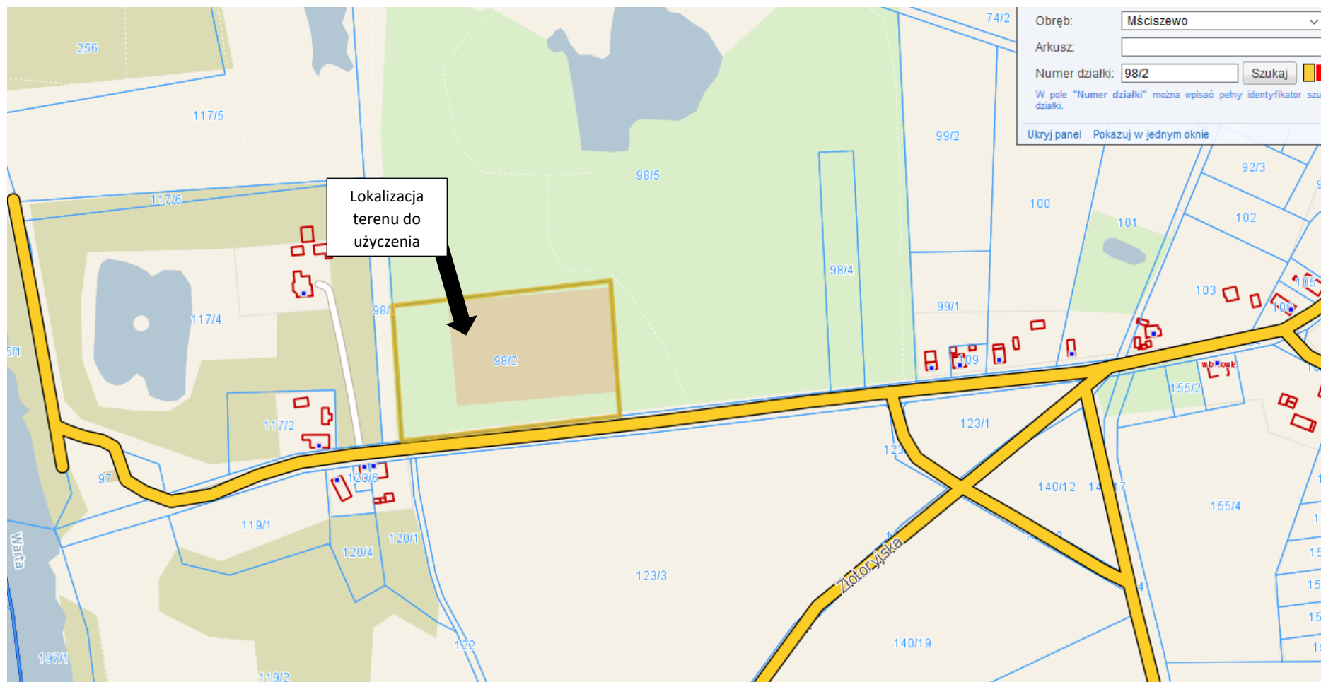
Mapa z zaznaczonym terenem do użyczenia.