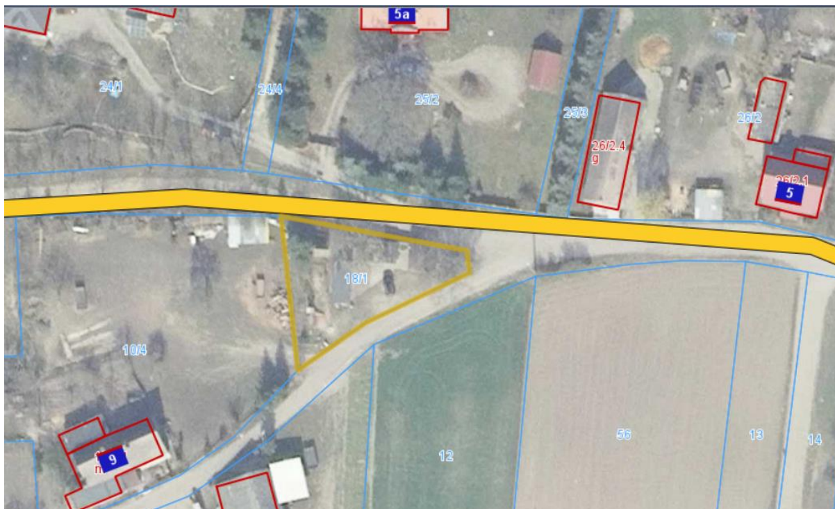
Mapa z zaznaczoną nieruchomością do użyczenia położoną w Starczanowie