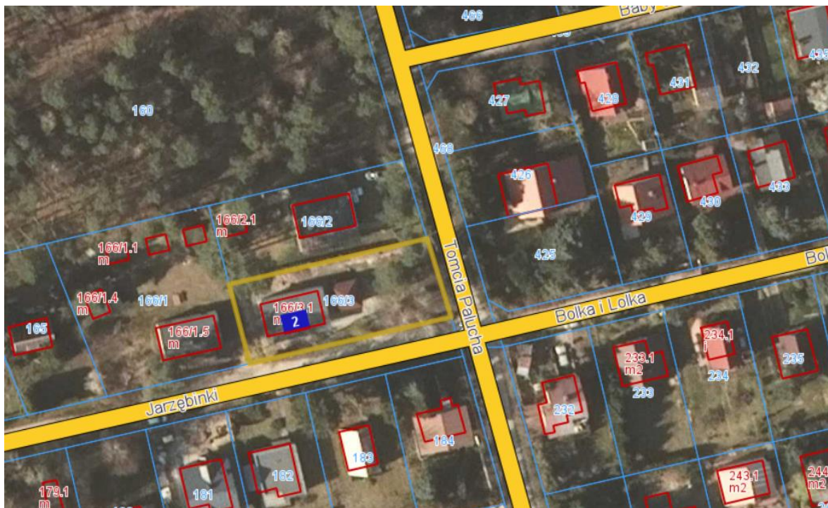
Mapa z zaznaczoną nieruchomością do użyczenia położoną w Wojnowku