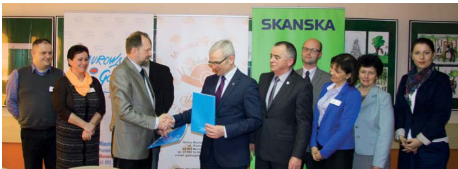
Uczestnicy podpisania umowy na budowę ul. Kolejowej.

Zakres robót obejmuje: budowę kanalizacji deszczowej, budowę oświetlenia ulicznego, przebudowę nawierzchni jezdni o szer. 6,5