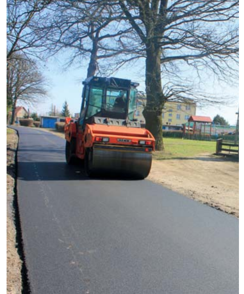
Rekonstrukcja dróg w Łopuchowie.