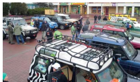
Konwój startował z Nowego Rynku na os. Zielone Wzgórze.