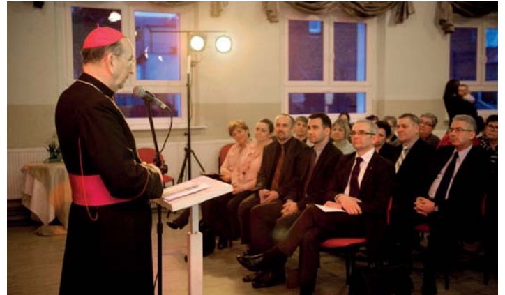
Narodowy Dzień Życia w Długiej Goślinie uświetnił swą obecnością Prymas Senior ks. abp Henryk Muszyński.

Narodowy Dzień Życia ustanowiony został przez Sejm Rzeczypospolitej Polskiej 10 lat temu. Celem tego święta jest propagowanie życia rodzinnego, świadomego rodzicielstwa i odpowiedzialnego wychowania. Prawie dekadę już, rok w rok, obchody tego Dnia na szczeblu lokalnym odbywają się 24 marca w Długiej Goślinie.