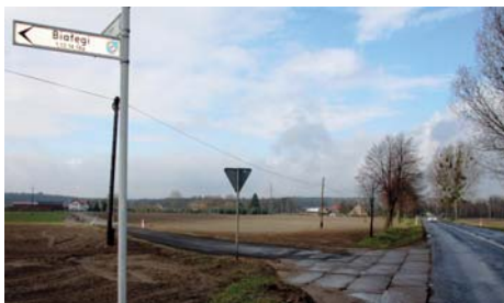
Jedna z wyremontowanych dróg.

Chciałbym podziękować wszystkim za pomoc w utrzymaniu oraz naprawie dróg. Kiedyś padło zdanie na zebraniu sołtysów w sprawie dróg, że „Białęgi sobie poradzą”. Tak - poradzimy sobie, bo na pierwszym