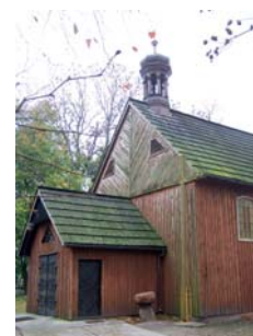
Kościół św. Katarzyny w Węglewie