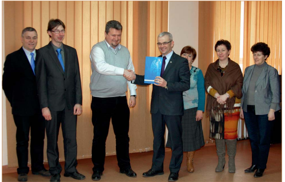
Podpisanie umowy na budowę ulic osiedlowych.

Z powyższych środków zostanie wykonany projekt oraz wybudowane pierwsze 100 m. drogi. W kolejnych latach, w budżecie gminy